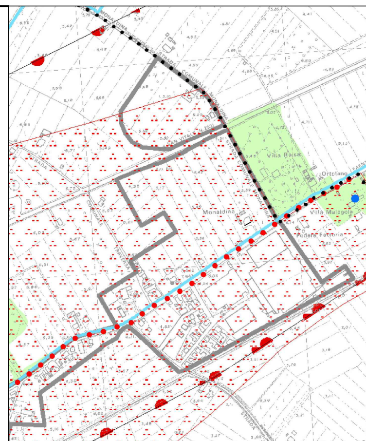
Estratto di PSC - Scala 1:10000