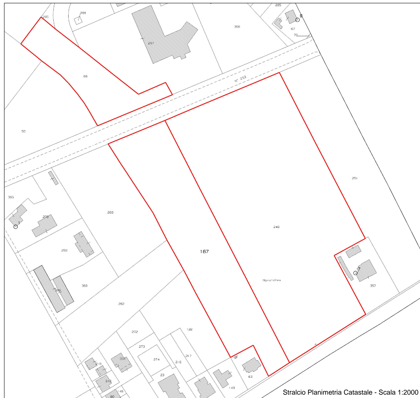
Stralcio Planimetria Catastale - Scala 1:2000